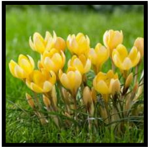
Krokus Chrysanthus Romance