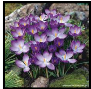
Krokus Tommasinianus Ruby Giant